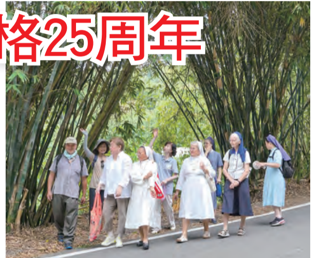
▲徒步朝聖活動，沿途欣賞並讚頌受造界的美好。

所有參禮者，有教友領受教宗降福狀後，歡欣雀躍地表示：「這是我家的第一張教宗降福狀，又可以獲得全大赦，好感動！一切都是恩寵，感謝天主！讚美天主！」