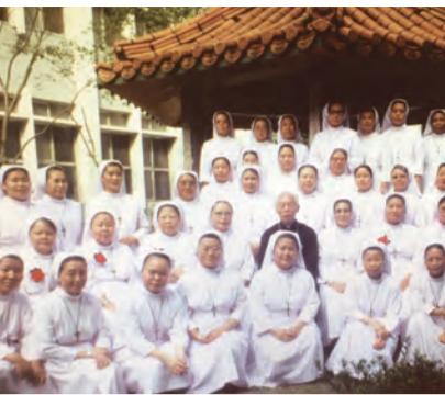
▲修女們與羅光主教（二排中）在會院合影。