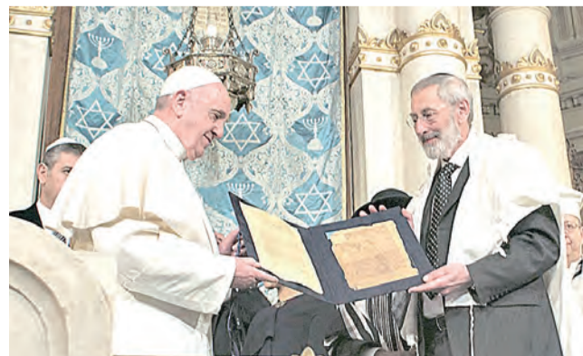
▲2016年1月17日，教宗方濟各為第三位拜訪羅馬猶太會堂的教宗