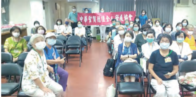
▲中華聖賀德佳全人發展協會召開年度大會，會員踴躍參加。