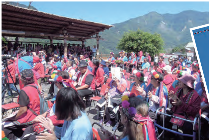
▲奉獻禮伴隨嘹亮的族語吟唱聲進場，充滿原住民風情！