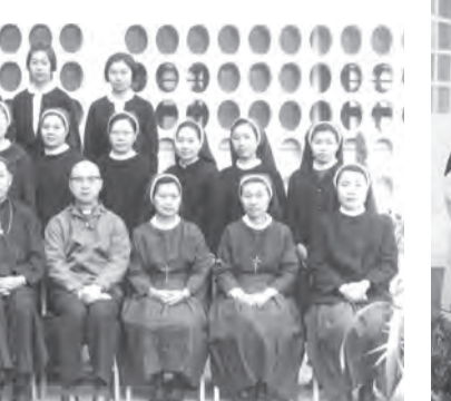
▲1958年，修女們在聖家會高雄會院歡迎聖言會總會長（前排中）來台視察。