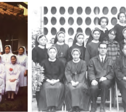
▲成世光主教（前排左四）在台南建立德光女中，與修女們合影。