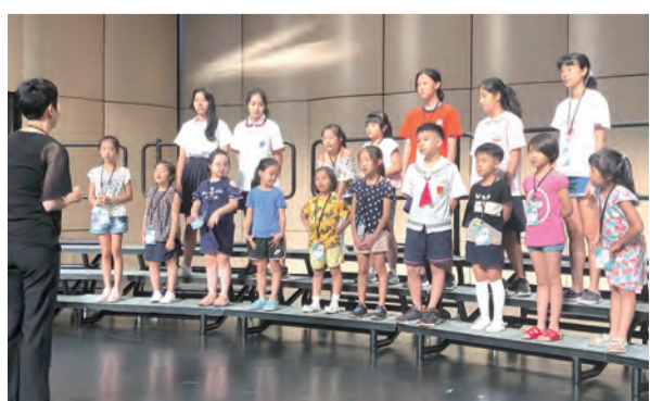
▲演出前，緊鑼密鼓地彩排，力求有最美好的呈現。

特別愛孩子的聖鮑思高曾說：「只要你們是年輕人，我就萬分愛你們」、「我的最後一口氣也會為你們而活」，孩子們正是天國的子民，能在地