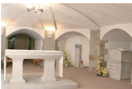
▲聖堂地下室的小聖堂和會祖永息之所