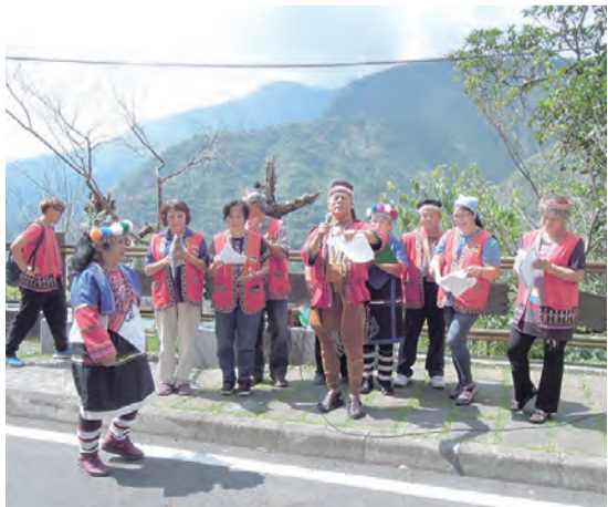
▲餐會時生動風趣地演出，令人無以暇食。

聯合堂區席開數十桌宴請全體參禮者，席間聯合堂區所屬各堂接續以精彩的表演節目助興，會場瞬間充滿歡樂氣氛。大家愉快享用平地相當難見的特色佳餚——阿里山風味餐與烤山豬。同時也再次齊聲感謝讚美天主，因天主的特別降福，讓阿里山聯合堂區穩步走過一甲子，迄今屹立不搖地挺立在巍峨的阿里山上。祝福聯合堂區在本堂神父及副本堂神父的領導下，邁向更亮麗的60年。