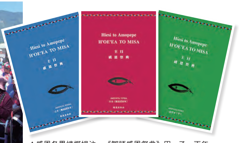
▲感恩各界慷慨挹注，《鄒語感恩祭典》甲、乙、丙年，終於開花結果，為原住民信仰文化傳承帶來莫大助益。