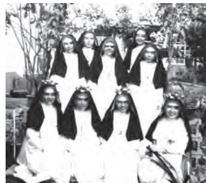
▲1956年10月7日玫瑰聖母瞻禮，聖家獻女