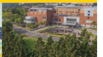
渴望渡假會館與萬坪公園