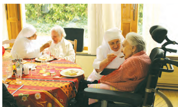
▲修女們服事長者用餐，悉心關照長者身心靈健康。