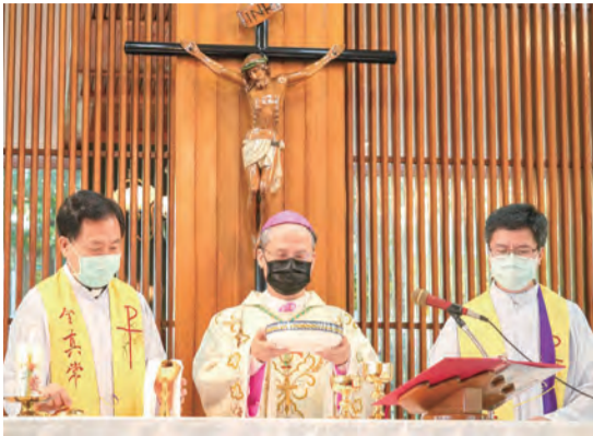
▲感恩聖祭恭請李克勉主教主禮，李主教勉勵所有人效法聖女小德蘭芳表。