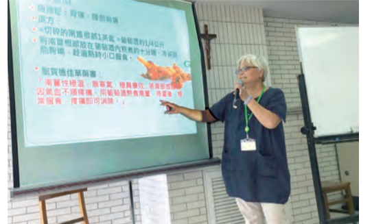
▲於聖佳蘭修道院解說聖賀德佳藥方南薑酒