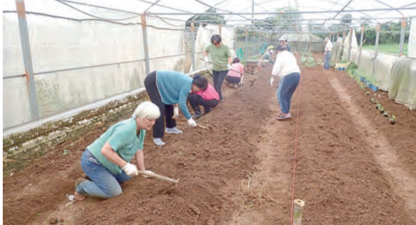
▲協會理事長帶著志工們在賀德佳花園工作。