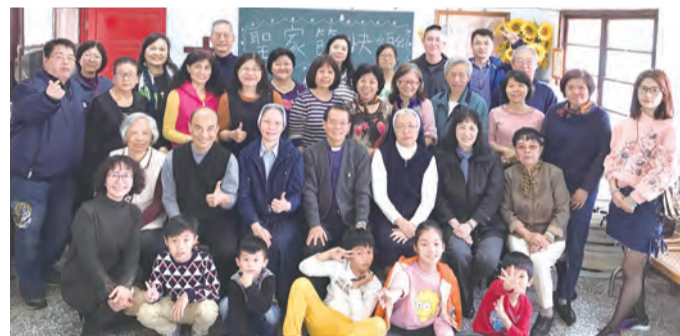
◀雪梨分會聖家節共融