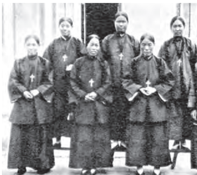
▲110年前，山東兗州教區的第一批聖家會修女。