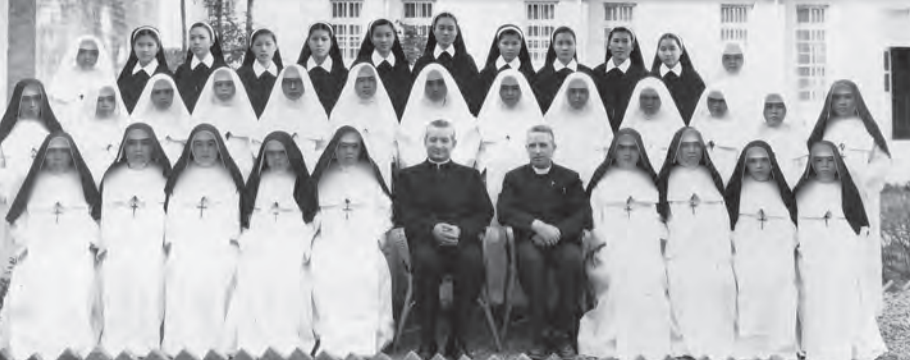
▲聖家會創會100年，在高雄玫瑰堂神長與修女大合照。