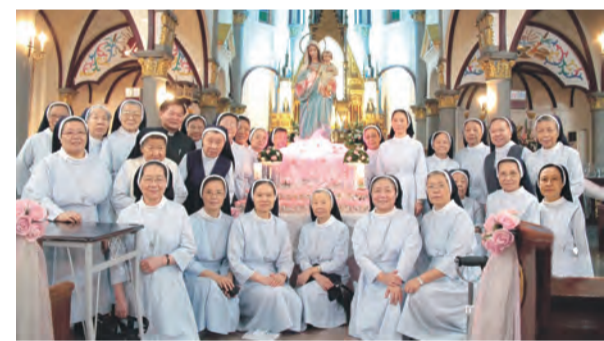
▲聖家會創會100年，修女們在高雄玫瑰聖殿獻上感恩。