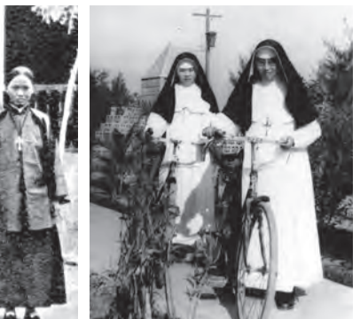
▲聖家會修女在嘉義辛勤福傳