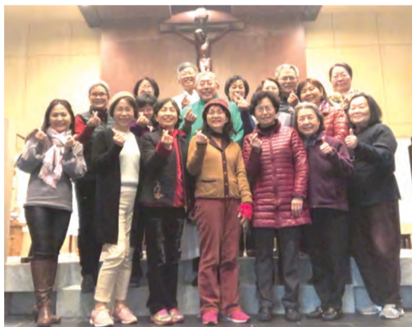
▲家協中心年度派遣宣誓彌撒中，回應愛的召叫。