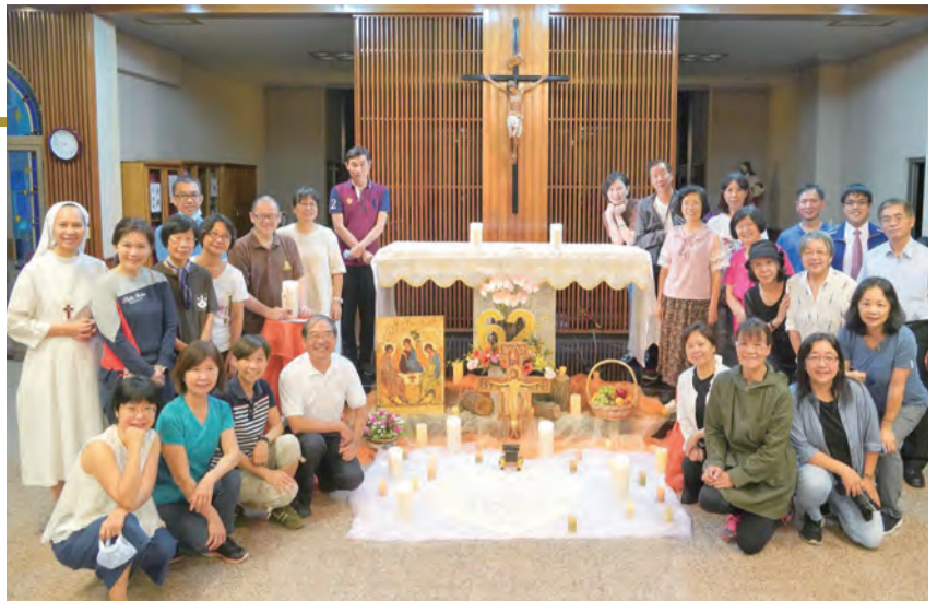
▲泰澤祈禱及明供聖體，與主相逢寧靜中，心神獲益豐碩。