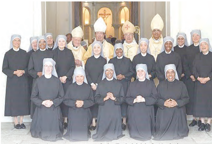
■文·圖/Monica LIU (安貧小姊妹會修女)