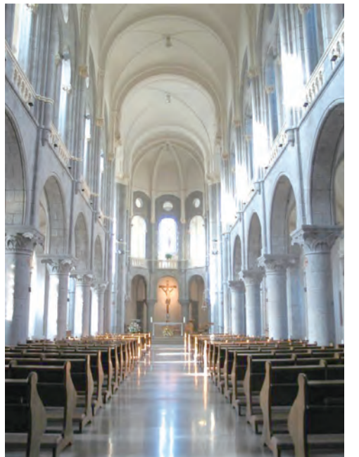
▲法國蘭都總會院聖堂內觀，神聖莊嚴。