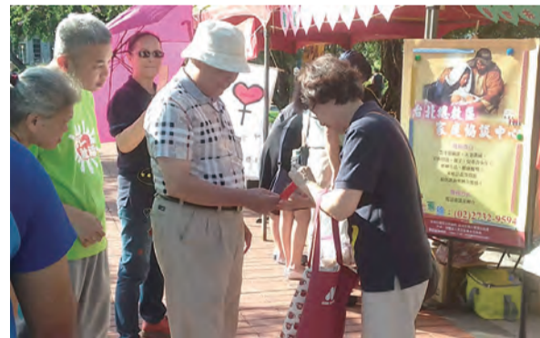
▲家協中心志工在榮星公園的活力嘉年華創意福傳。