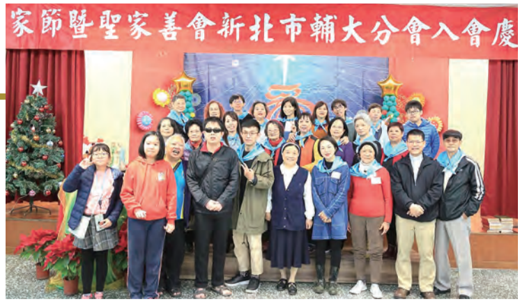
▲輔大分會聖家節歡迎新會員入會 ▼台北分會與神長及修女們喜樂共融