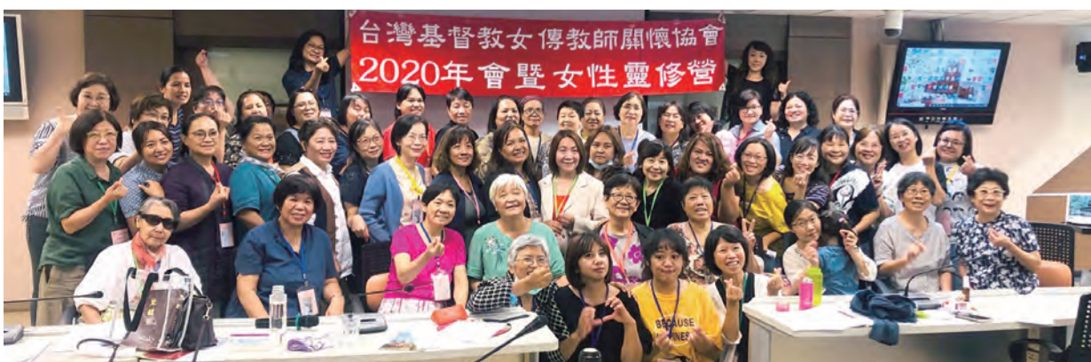
台灣基督教女傳教師關懷協會 2020年會暨女性靈修營

11月5-6日在康泰醫療教育基金會將舉辦「聖賀德佳慢療食療兩日工作坊」，月底將會有「聖賀德佳溫和禁食營」，歡迎教友們共襄盛舉！