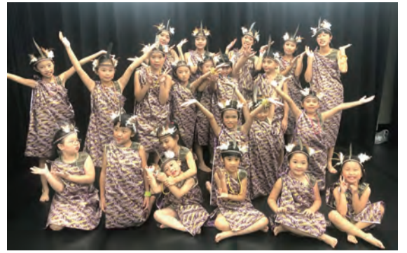
▲身著非洲叢林裝，獻唱非洲語〈天主經〉，充滿異國風情。