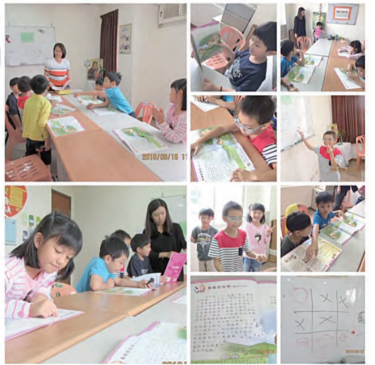
▲圖文並茂的聖經故事觸動小朋友的思維與情感，更認識天主。

榮 休台北總教區洪山川總主教2016年準印《給孩子的喜訊》，終於在大家的矚目期盼下全套出版問世，令我這個剛完成教理老師培育的新手雀躍不已，內心直呼幸運！才起步的我便可以有教區認可的兒童信仰教材參考使用。在此特別感謝前本堂柏實理神父對我的完全信任，給予我在選擇主日學教材時的絕大空間並在經費上的支持，致使這套以聖經事蹟為主的彩色教材至今仍在主日學教室中繼續使用著。