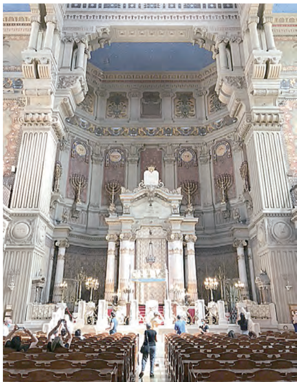
▲羅馬猶太主會堂

今年9月6日是歐洲猶太文化開放日，當天位於猶太區內的猶太主會堂及西班牙會堂、猶太歷史博物館、大屠殺紀念館及史料館等，可免費參觀且有專人導覽。趁著尚未爆發第二波新冠肺炎疫情和遊客尚未塞爆羅馬的機會，我參加了一日的猶太文化與歷史巡禮，可謂收穫滿滿。