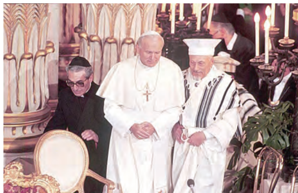
▲1986年4月13日首位拜訪羅馬猶太會堂的聖教宗若望保祿二世

當然，後來繼任的榮休教宗本篤十六世，以及現任的教宗方濟各，仍都秉持著聖教宗若望保祿二世遺留下來的良好傳統——定期拜訪猶太會堂。我在歐洲猶太文化日所學到的，不僅是效法這幾任教宗們謙遜的表率，懂得尊重天主各式各樣的子女，更重要的是能在「同中存異，異中求同」，以實際的行動來證明信仰上的手足之情，才能讓彼此願意開放，進而成就真正的宗教交談！